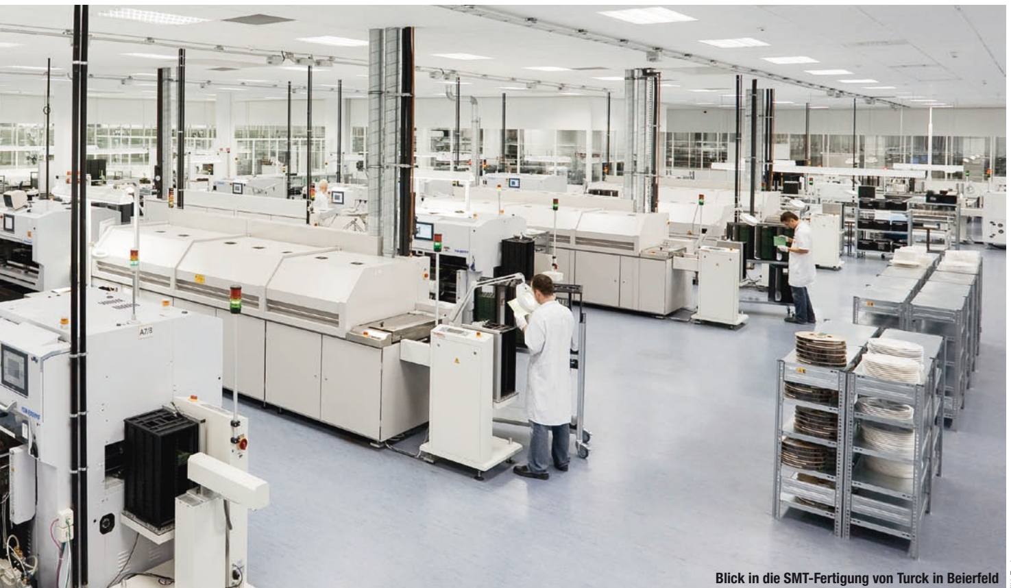
Blick in die SMT-Fertigung von Turck in Beierfeld